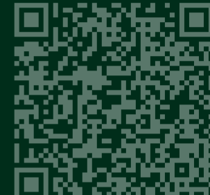
Tour virtual 360° de l'interior

L'any 904 el bisbe de Girona Servus Dei consagrà una església dedicada a Sant Pere al lloc de Camprodon. Entre el 948 i el 950 (aprox.) el comte Guifré II de Besalú l'erigí com a monestir benedictí. L'abat i els monjos benedictins foren els principals organitzadors del creixement demogràfic i econòmic de Camprodon entre els segles X i XII. Al 1078 el comte Bernat II l'uní al