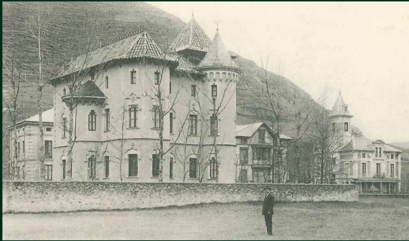
Can Roig, a principis del segle XX