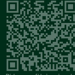
Birba, una fàbrica singular