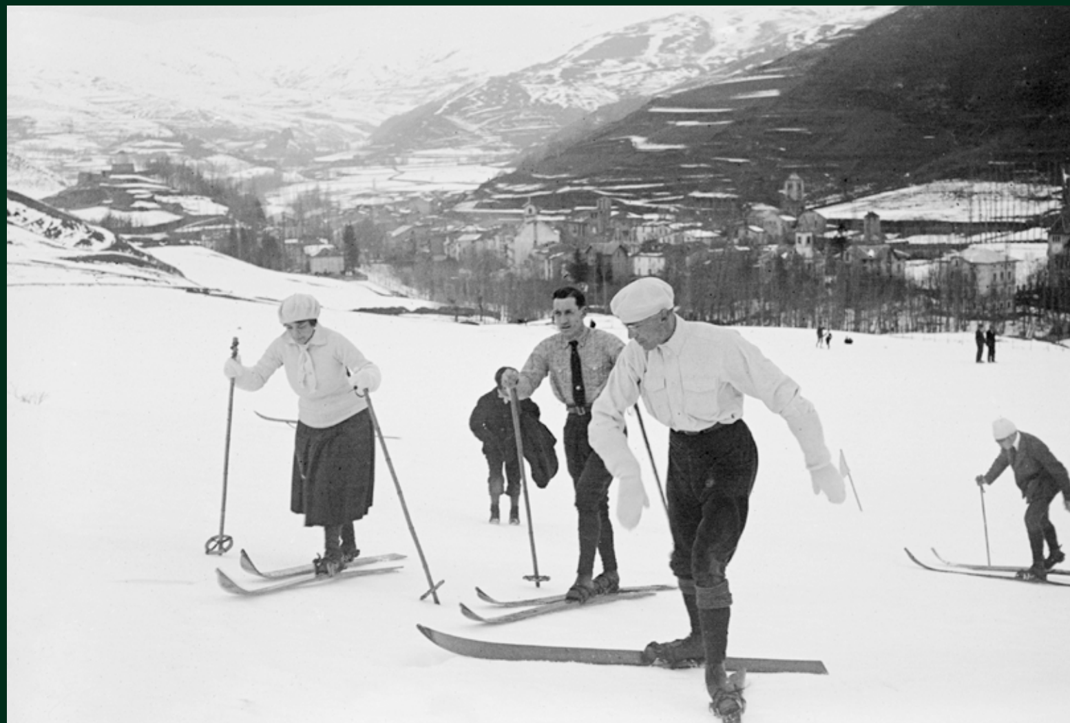
Esquiadors a la falda de la muntanya de Sant Antoni, abans de les estacions d'esquí